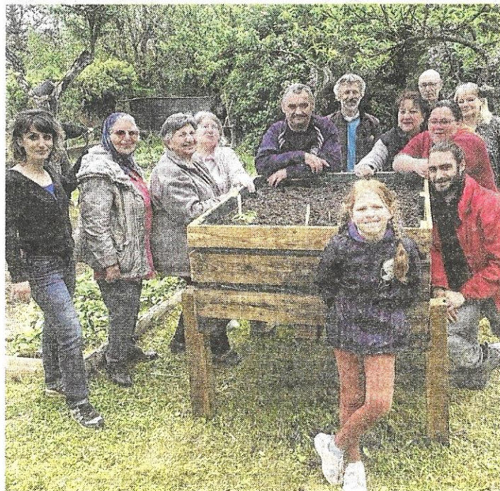
L'équipe du jardin du Meret, qui distille joie de vivre et bonne humeur.

Chez les inconditionnels, c'est le volontariat, dans une ambiance sereine et conviviale, qui a permis à nombre d'entre eux de retrouver, parfois de façon inespérée, leur équilibre et la joie de vivre qui va avec.